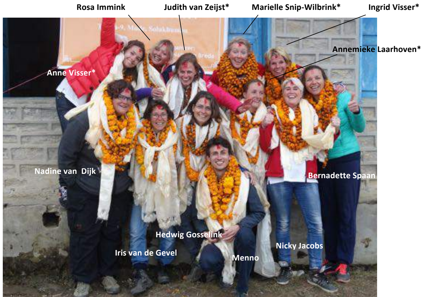
Teamfoto Nepal, Mudé 2014