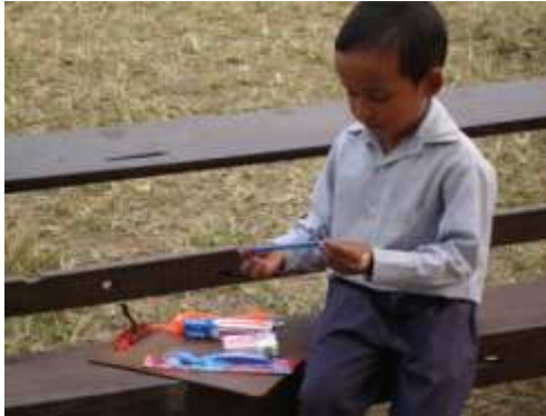
Trotse jongen die zijn cadeautjes aandachtig bestudeerd