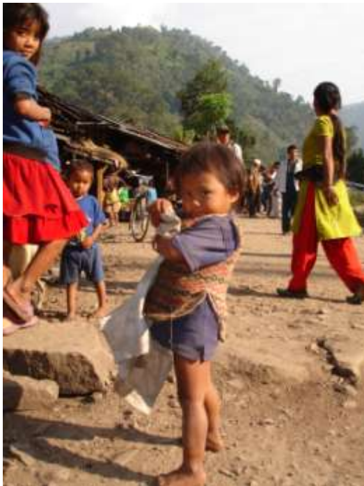
Pracht kindje, geen geld voor broek/schoeisel