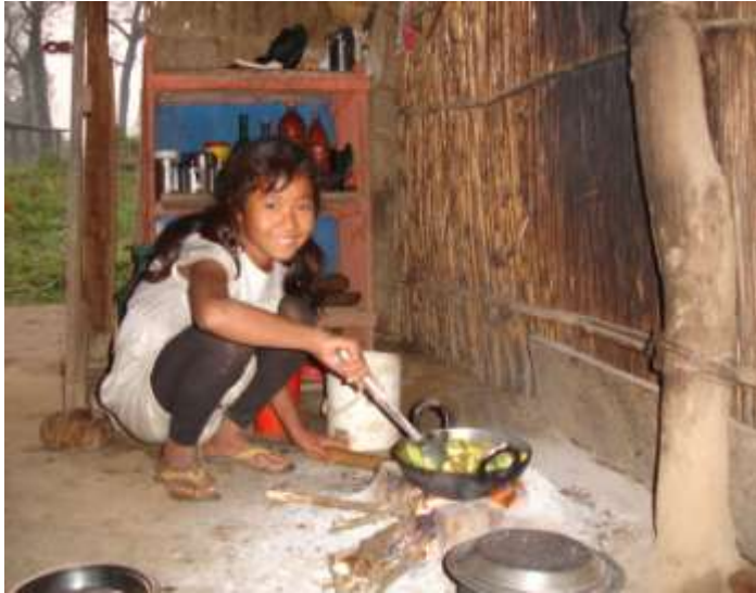
Meisje die kookt voor haar familie in hun huis